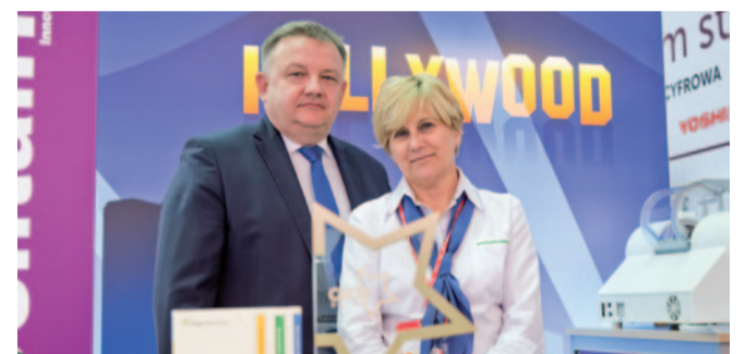
GWIAZDA CEDE w kategorii MATERIAŁY