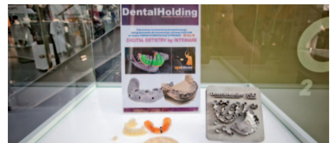
GWIAZDA CEDE w kategorii EDUKACJA/IT

SEYSSO Gold Black (WM Brands sp. z o.o.) to połączenie najlepszych cech szczoteczek sonicznych. Wyjątkowa prędkość, pięć programów pracy oraz nadzwyczajnie wydajny akumulator. Produkt znakomicie sprawdzi się podczas wybielania zębów (program White, aż 96 000 drgań!) oraz w podróży (etui z funkcją ładowania).