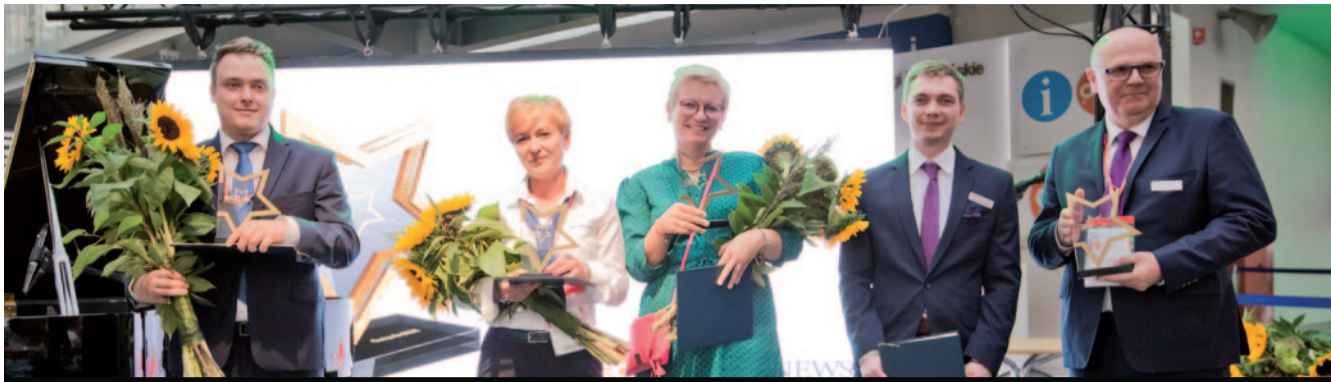
Skaner wewnętrzny Emerald, Collagen Membrane, szczoteczka soniczna SEYSSO Gold Black oraz oprogramowanie Inteware – to produkty, które znalazły najwyższe uznanie głosujących w internetowym plebiscyie Gwiazdy CEDE 2018.