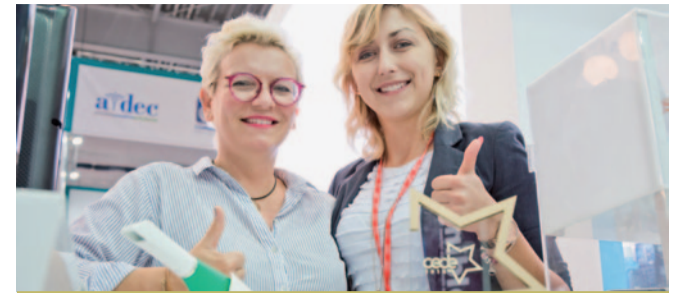
GWIAZDA CEDE w kategorii SPRZĘT