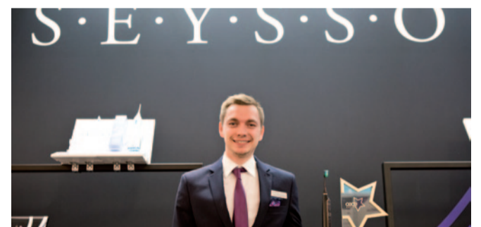
GWIAZDA CEDE w kategorii PROFILAKTYKA

Blisko 1000 osób skorzystało z oferty bezpłatnych forów edukacyjnych Stomatologia 3.0 (Partner: DentalHolding), Dental Club i Business Dental Forum, które były nowością CEDE 2018. Praktykowana na całym świecie edukacyjna formuła „przysiądź się – posłuchaj” będzie kontynuowana w kolejnych latach.