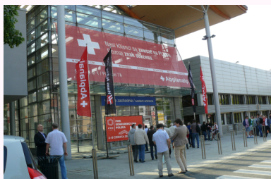
Lokalizacja reklamy - patrz mapa na str. 10

Baner na siatce winylowej umieszczony nad wejściem zachodnim do „czteropak” (paw. 7, 7A, 8, 8A) od ul. Śniadeckich.