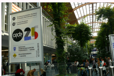
Lokalizacja reklamy - patrz mapa na str. 10