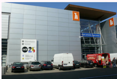
Lokalizacja reklamy - patrz mapa na str. 10

Baner na konstrukcji na zewnątrz pawilonu 7A od strony pawilonu 15 (w pawilonie 15 odbywają się wykłady Kongresu)