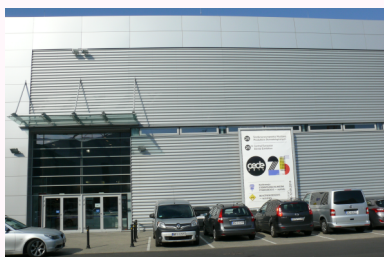
Lokalizacja reklamy - patrz mapa na str. 10

Reklama - baner na konstrukcji na zewnątrz pawilonu 8A od strony pawilonu 15 (w pawilonie 15 odbywają się wykłady Kongresu)