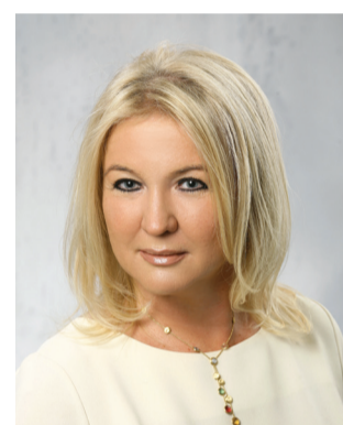
Wystawa i edukacja – perfekcyjne połączenie