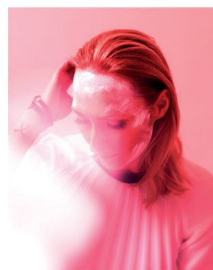
Gwiazda wieczoru – Anita Lipnicka

Kiedy śpiewa – wszystko się może zdarzyć. Jedni będą podrygiwać nogą, inni płaszc pod sceną. Jesteśmy pewni, że wszyscy uczestnicy koncertu Anity Lipnickiej będą wspólnie śpiewać największe przeboje jednej z najlepszych wokalistek ostatniej dekady.