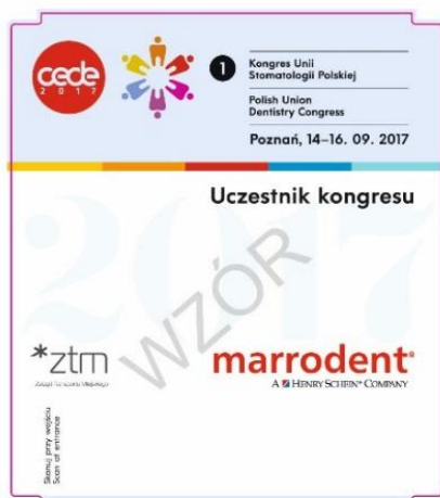
Uczestnik Kongresu Unii Stomatologii Polskiej