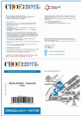
wzór bezpłatnej karty wstępu

Wstęp na wystawę CEDE 2017 jest bezpłatny dla wszystkich zainteresowanych po rejestracji.