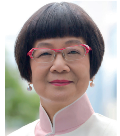
DR TIN CHUN WONG Prezydent FDI (do 25 września 2015 r.)